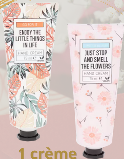
1 crème pour les mains