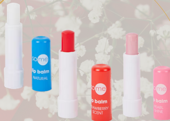
1 baume à lèvres