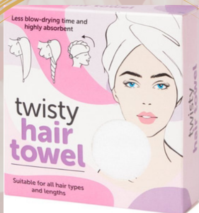
1 serviette pour cheveux