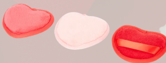
1 coton démaquillant réutilisable